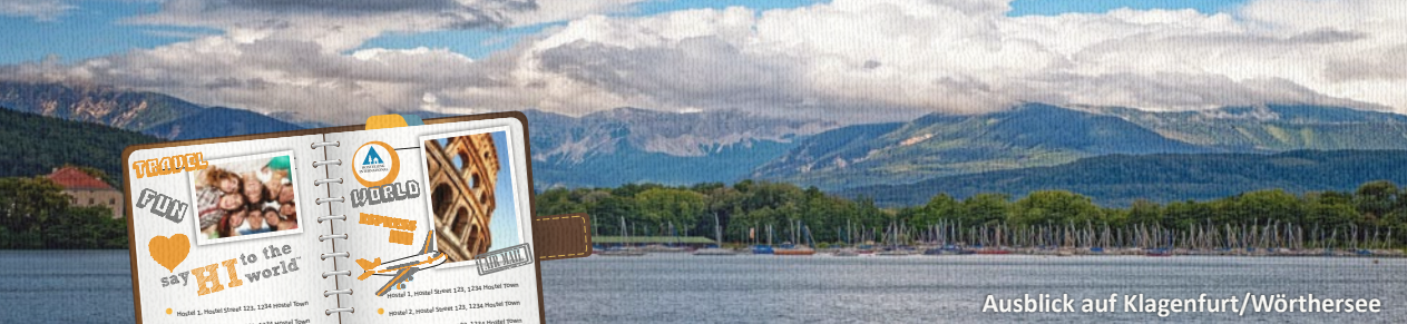
Ausblick auf Klagenfurt/Wörthersee