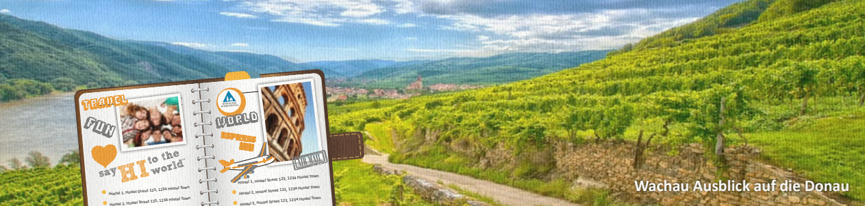
Wachau Ausblick auf die Donau